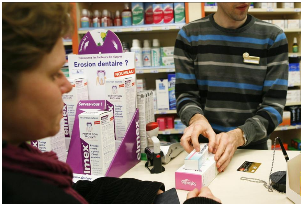
En plus de la version papier, le questionnaire est accessible sur Internet avec possibilité de le compléter.